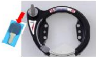
シリンダー式馬蹄錠