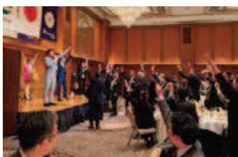
DAIKI によるビンゴ大会では 全員同時にビンゴー!