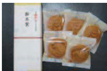
ハトマーク・あいぼっぼの 焼印入りの千なり