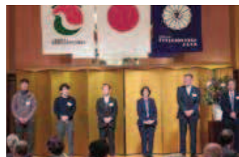
新・転入会員(令和5年1月~12月)ご紹介