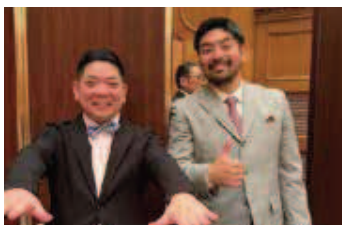
初夢抽選会の司会を担当した nobodyknows+ のお二人