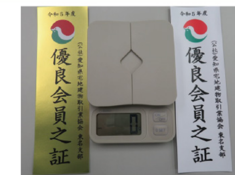
記念品はステッカーと レタースケール