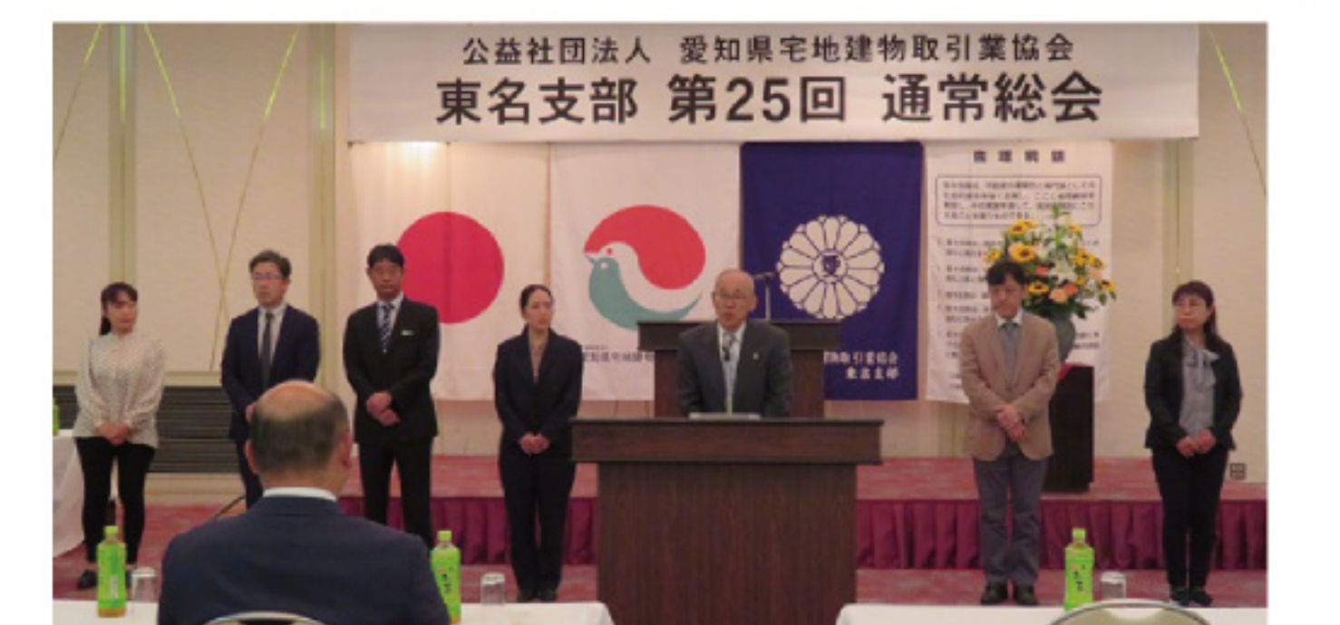
退任役員の皆さん